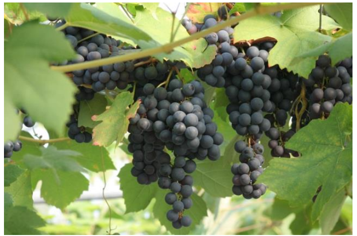
Vitis labrusca 'Zilga'

Vattning: Ge plantan rikligt med vatten minst en gång i veckan när det inte regnar tillräckligt. En tumregel är att 30 mm vatten tränger ner ca 30 cm i jorden.