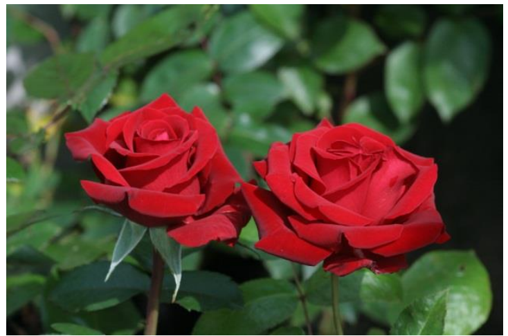
Rosa 'Ingrid Bergman'

Ta loss krukan, håll plantan på lämpligt djup och fyll på till ca hälften med jord. Tryck eller trampa