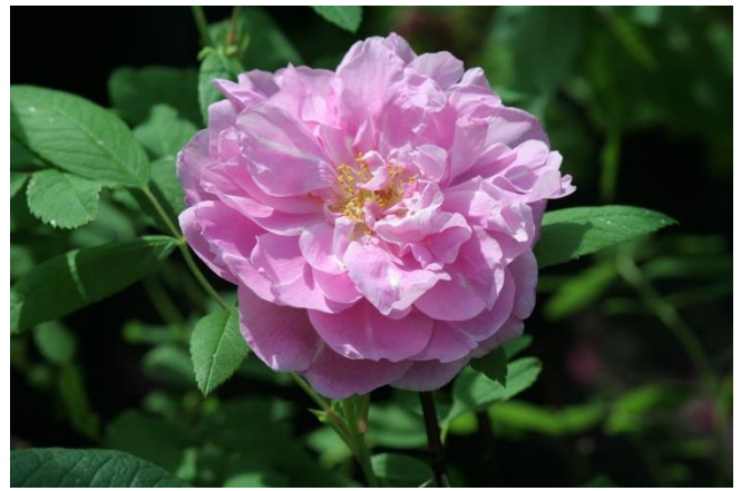
Rosa 'Therese bugnet'

Häckar av till exempel vresrosor kan beskäras regelbundet varje år eller gallras ur rejält vart 3-5 år. Klipp grenarna ända nere vid marken.