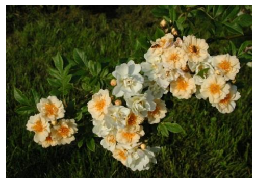
Honungsros Rosa Hybrida (Helenae- gruppen)

Klätterrosor skyddar du mot den starka vårvintersolen genom att täcka med juteväv. Den kan vara kvar fram tills det är dags att beskära.