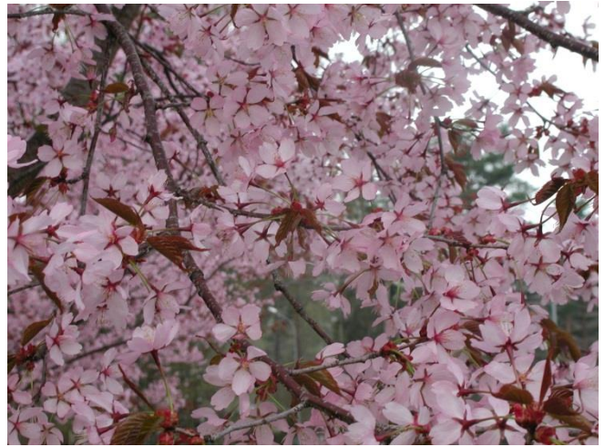
Japanskt prydnadskörbär Prunus 'Kanzan'

Plantering: Ta bort krukan och lossa rotsystemet lite försiktigt. Står trädet i nät av jute kan det vara kvar, klipp upp kanten och vik ner så den kommer under jordytan efter plantering.