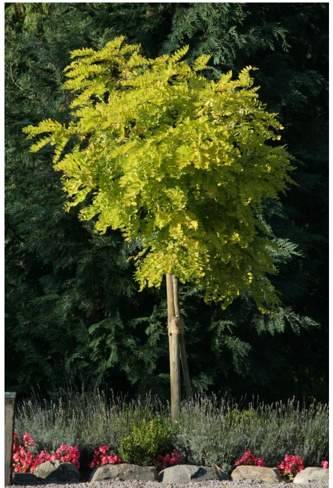
Korstörne Gleditzia 'Sunburst'

För att växterna ska förbereda sig bra för kommande vinter bör ingen kvävegödsling ske till träd och buskar efter midsommar.